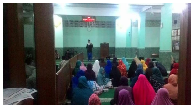
Gambar 2 Dokumentasi kegiatan kedua