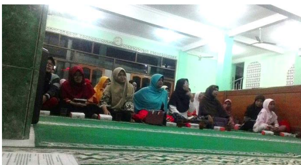
Gambar 1 Dokumentasi kegiatan pertama

Kegiatan pertama pengabdian ini dilaksanakan secara luring di Masjid an-Nashir dengan diikuti oleh 55 jamaah. Pada kegiatan ini materi terkait karakteristik fikih Muhammadiyah dan manhaj tarjih diberikan kepada para jamaah dengan metode ceramahan dan diskusi. Pada kegiatan pertama ini, tampak bahwa banyak jamaah yang baru mengetahui karakteristik fikih Muhammadiyah dan manhaj tarjih. Ini tampak dari pertanyaan-pertanyaan yang muncul dari para peserta, sekaligus pengakuan dari mereka pada saat sesi diskusi. Dalam kegiatan kedua, tim pengabdian memberikan materi terkait fikih ibadah kepada para jamaah. Dalam kegiatan ini, jamaah diberikan wawasan terkait fikih ibadah menurut Muhammadiyah. Tampak antusiasme dari para jamaah di sesi ini, dan setelah kegiatan ini usai, jamaah memberikan pengakuan tentang meningkatnya pengetahuan tentang faham fikih ibadah menurut Muhammadiyah.